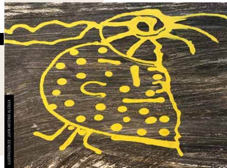
ILUSTRACIÓN DE JUAN ANTONIO ALGOLEA